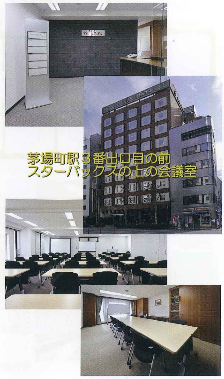
茅場町駅3番出口目の前 スターボックスの上の会議室