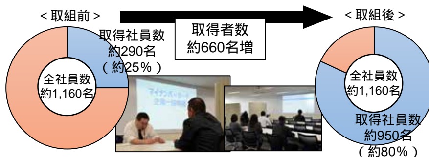
C社のマイナンバーカード取得状況