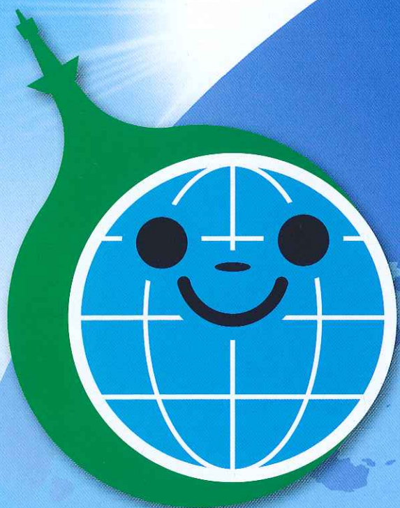
シンボルマーク「ぼうしちゃん」