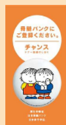
ドナー登録のしおり「チャンス」